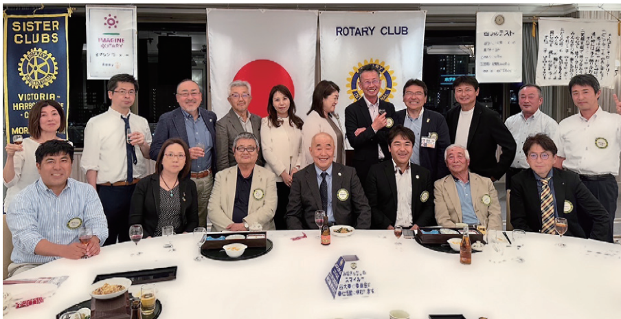
クラブ協議会終了後の懇親会